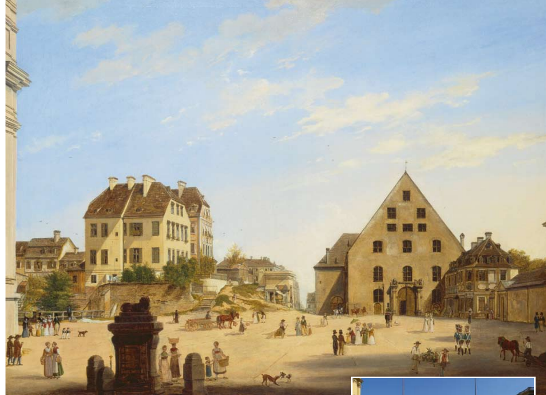
Das Ende Münchens: Domenico Quaglio malte 1822 das Gebiet des heutigen Odeonsplatzes mit Blick Richtung Schwabing. Ganz links erkennt man noch die Theatinerkirche, auf den Resten der Wallanlagen stehen Privathäuser wie das Chedeville-Schlössl, die Leo von Klenze gemeinsam mit der alten Befestigung für die Neugestaltung von Odeonsplatz und Ludwigstraße einebnen lässt. Rechts neben der Schwabinger Landstraße die alte Reitschule. Im kleinen Gebäude daneben das Café Tambosi, das seit 1774 besteht. Kleines Bild: die gleiche Sicht heute.

Ursprünglich sollte das Schönfeld, das sich im Norden unmittelbar an die Residenz zwischen der heu-