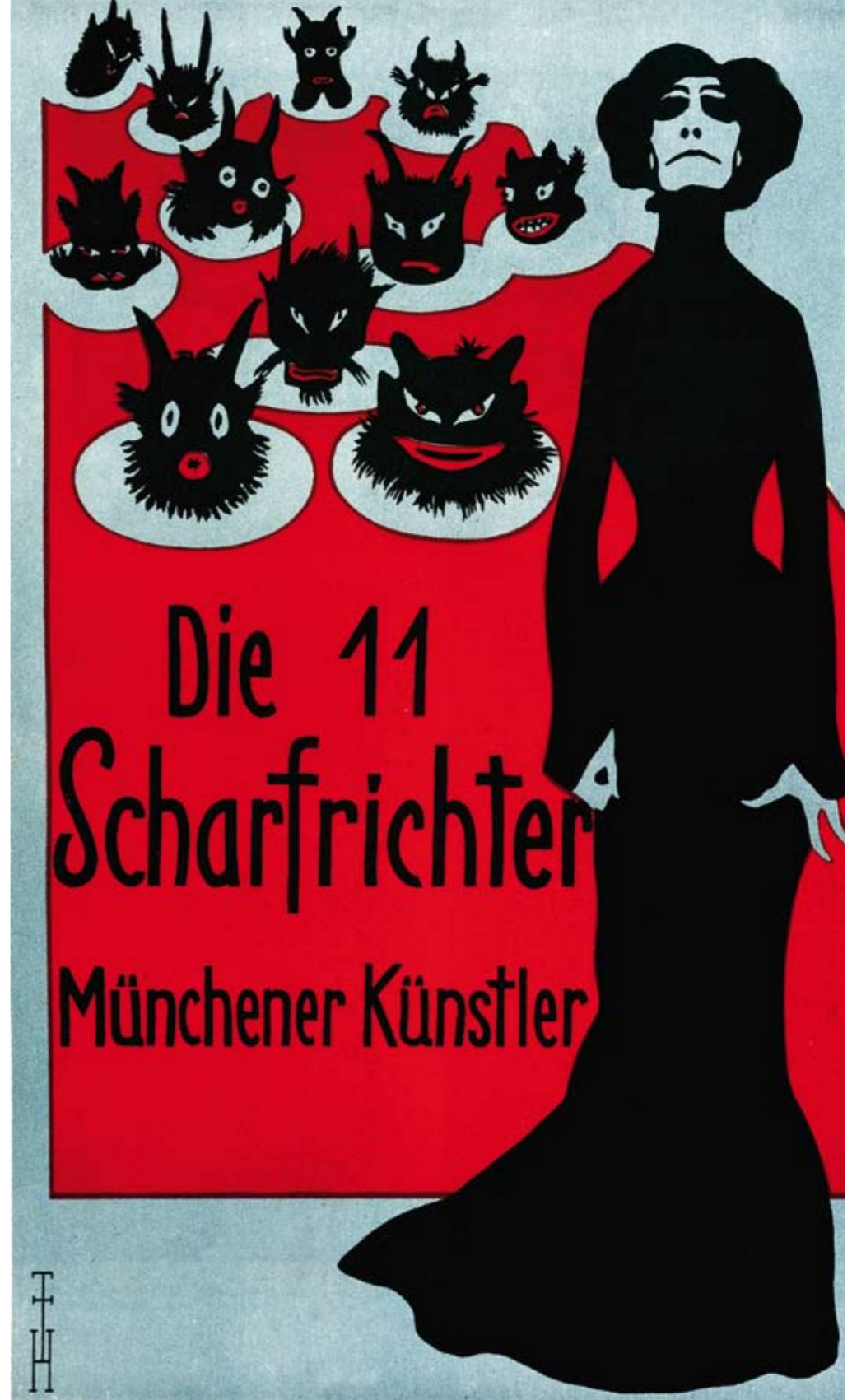
Plakatklassiker: Das berühmte Poster für die Elf Scharfrichter entwarf Thomas Theodor Heine im Jahr 1900.

Neben seiner Rolle als Auftraggeber für zeitgenössische Künstler trat Ludwig I. auch als Sammler auf. Schon 1809 erwarb er sein erstes Gemälde, Die büßende Magdalena von Friedrich Heinrich Füger. Die Neue Pinakothek, den ersten Ausstellungsbau für Gegenwartskunst, finanzierte er aus eigenen Mitteln. Auch der Glaspalast, ursprünglich für eine Industrieausstellung errichtet, wurde zum Ort für international bedeutende Kunstausstellungen. Der Plan, München zu einer Stadt der Künste zu machen, konnte bei diesen Aktivitäten fast nicht fehlschlagen: Um 1890 lebten nahezu 3.000 Maler und Bildhauer in der Stadt. Aber