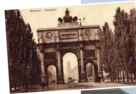
Beginn der Maxvorstadt: 1913 fuhr die Straßenbahn durch das Siegestor (o.). Nach dem Krieg wurde es zunächst nur einfach wiederaufgebaut (u.), die Postkarte von 1950 zeigt noch, dass Verzierungen und die Quadriga fehlen (r.).

Trotz der königlichen Vorgaben gelang es Friedrich von Gärtner, eine pure Kopie des Konstantinbogens zu vermeiden. Er ließ sich auch vom Titus- und vom Septimus-Severus-Bogen sowie vom Pariser Arc de Triomphe inspirieren. Hohe Kapitelle tragen die Säulen, die die klare vertikale Gliederung betonen. Die fast schwebend wirkende Quadriga, 1852 geschaffen von Friedrich Brugger, Martin von Wagner und Johann von Halbig, betont seine Mittelachse. Die bronzenen Bavaria fährt mit ihrem von vier Löwen gezogenen Streitwagen stadtauswärts in die Mitte des 19. Jh. noch vorherrschenden Felder und Wiesen außerhalb der Stadt, quasi dem siegreich heimkehrenden bayerischen Heere entgegen. Die zähnefletschenden Löwen bewachen gleichzeitig die Stadt. Ludwig I. selbst verfügte, dass die Quadriga niemals umgedreht werden dürfe. Martin von Wagner, der die »großartige Beschäftigung« bekam, das Skulpturenprogramm zu entwerfen, sah sich dem Problem gegenüber, »dass dieser sogenannte Triumphbogen keinen bestimmten Zweck oder eigentümliche Bestimmung hat und folglich allen daran anzubringenden Bildwerken eine nähere Beziehung und Bedeutung fehlt«. Im Gegensatz zu seinen Vorbildern in Rom oder Paris diente das Siegestor keiner Erinnerung an militärische Siege, es diente nicht der politischen Propaganda antiker Potentaten. Ludwig I. wünschte nur völlig unverbindliche Schlachtenszenen, die den Kampfesmut der Ba-